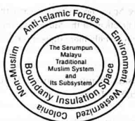
Fig 2. The Serumpun Malayu Traditional Muslim System And Its Environment

According to Sardar, the spiritual subsystem is the insulating space which would allow Muslim to shape their values and Islamic world-view. The insulating space is the guide parameters of Islam or guidance which is provided within a framework of basic Islamic concepts such as the Concept of Iman (faith), birr (righteousness), taqwa (piety), life, equality, peace and morality, among many others (Sardar, pp 239-245).