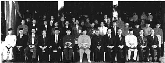
Gambar T.Y.T. Yang di-Pertua Negeri Melaka dan Y.A.B. Ketua Menteri Melaka bersama-sama dengan Gabenor dan wakil-wakil serta pembentang kertas kerja selepas Majlis Perasmian Pertemuan Selat Melaka pada 28 Ogos 1997 di Paradise Malacca Village, Ayer Keroh, Melaka.